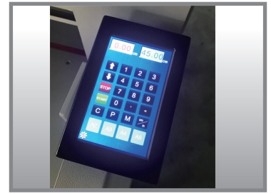
▲ 99組程式記憶，每組99刀；具連續裁切功能、推紙功能