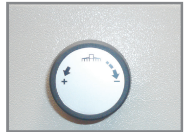
▲ 變速手轉輪可調整後檔位置