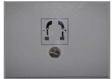
▲ 刀片深度可由電腦微調或機器外部調整