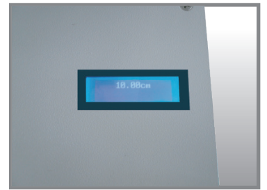
▲ 具LCD顯示mm/inch (480D)