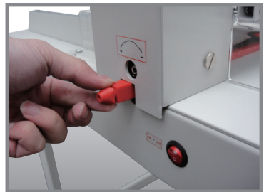
▲ 簡易刀墊更換設計